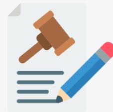
중소기업확인서 및 법인등기부등본