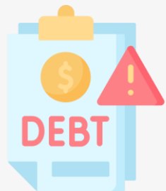
채무불이행 여부 확인서류