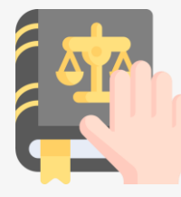
사업 유의사항 이행 서약서