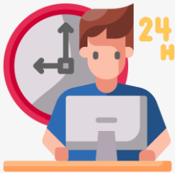
유사사업 수행실적 총괄표