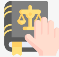
성실이행 및 변경사항 통보의무 서약서