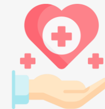
건강보험 사업장 가입자 명부