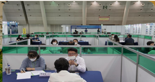
해외 및 국내 바이어 상담회