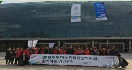
타지역 관광객 경남투어