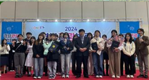
GNTF 대학생서포터즈 12기