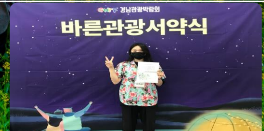
바른관광 서비스 서약식