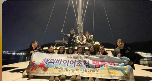
경상남도 베스트 관광지 팸투어